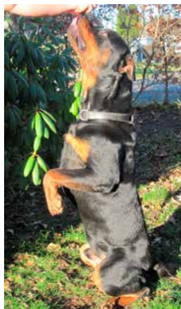
2: Hold en godbid op foran din hund...