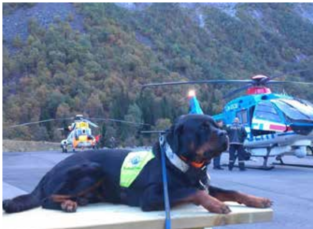
Joppe på opgave med det lokale politi.

melding 4-5 timer om ugen. Meget af træningen er motivations-træning, så forventningerne er høje til den dag, hvor det er en rigtig eftersøgning.