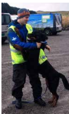
Træning med NRH.