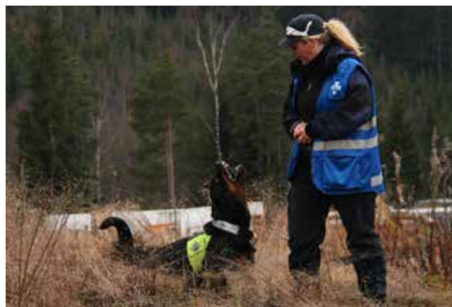
Træning med NRH.

stande. Sporet og sporingsformen til en redningshund er mere unøjagtig, end måden hvorpå man dømmer en IPO hunds spor. Årsagen er, at man på en rigtig aktion måske skal følge sporet i langt flere kilometer. Den anden prøve, der skal bestås, er en 800 meter lang rundering i skoven, hvor hunden søger 50 meter ud på begge sider af midterlinjen. Hunden skal finde og melde 3 figuranter. Prøven er bedømt, og dommerne lægger stor vægt på intensiteten i søgningen og samarbejdet. Der er en tidsbegrænsning på begge prøver på 40 minutter. Ud over søgeprøverne, som man består i forbindelse med en eksamensuge på et hovedkursus, skal ekvipagen udføre prøver i forskellige scenarier og løse disse. Man skal bl.a. gå et spor, som er 3 km langt, gennemsøge et skovområde på 500x500 meter, tage de rigtige taktiske valg for søgningen, osv. Dommerne dømmer til sidst med det udgangspunkt om, hvorvidt man er en ”ressource for Redningstjenesten” og klar til at fremgå af beredskabslisten.