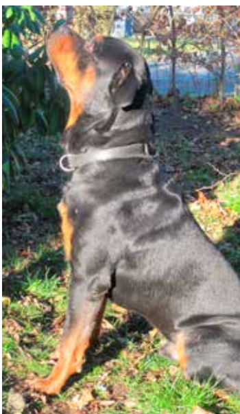
1: Begynd med hunden foran dig...