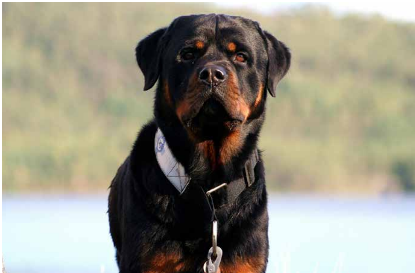
Læs om Redningshunden Joppe i artiklen på side 12-13.

Når det er sagt, glæder vi os bare til endnu et fantastisk år i Rottweilerens navn.