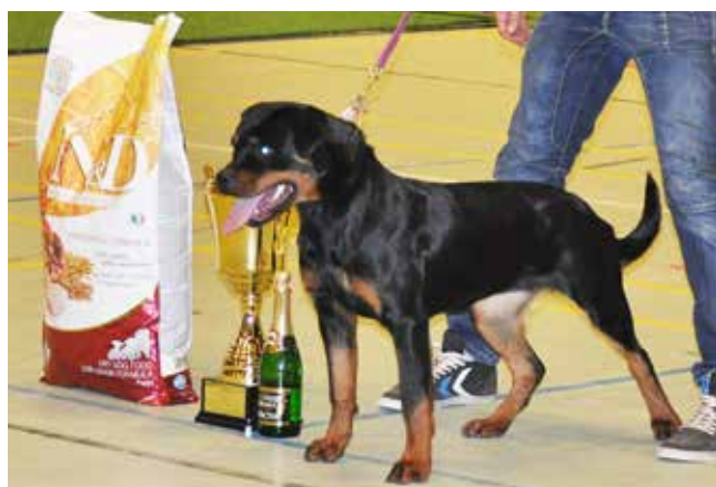
Vom Hause Luna's Siff Bedste hvalp.