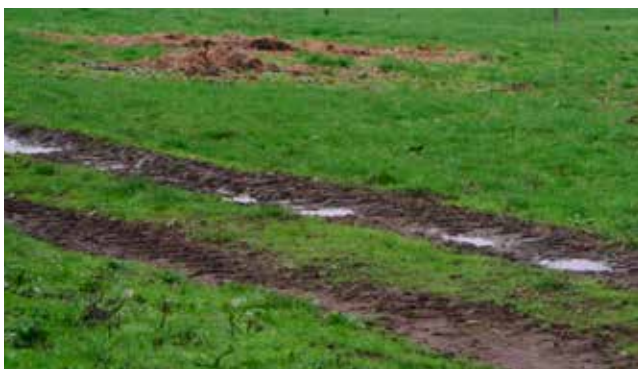
Hjulspor og bunker af halm på sporet.

Nr. 1 og 2 gik på marken lige overfor, hvor vi holdt parkeret. En fin mark, så det ud til. Så jeg faldt helt til ro og vidste, at det nok skulle gå. Da det blev min tur, og jeg hentede Cronus, fik jeg at vide, at mit spor var ved en anden gård, og at vi skulle køre knapt 1 km op af vejen. Da jeg så marken, tænkte jeg: "øv det var så det". Der havde helt sikkert gået kreaturer samme morgen, og ko-kasserne lå helt friske. På 1. langside var der to store felter med halm iblandet lort. Flere af langsiderne blev krydset af traktorspor, som så helt friske ud. I midten af midt spor, var en foderstation til dyrene, så der var klovmærker overalt. Ikke det optimale for et VM spor. Cronus lod dog til at være ligeglad og gik sikkert henover alle sværhedsgraderne. Kun vinklerne voldte besvær. Jeg var rasende over forholdene, men da dommeren belønnede arbejdet med 90 point, faldt jeg til ro. Cronus havde til sit første VM opnået 286 point, hvilket er fortrinlig prøve. Han var den yngste deltager, og jeg havde chancen for en topplacering!