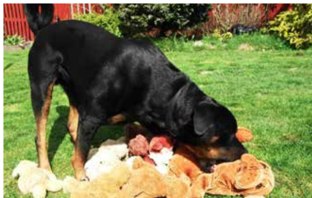
Eros med alle sine bamses.