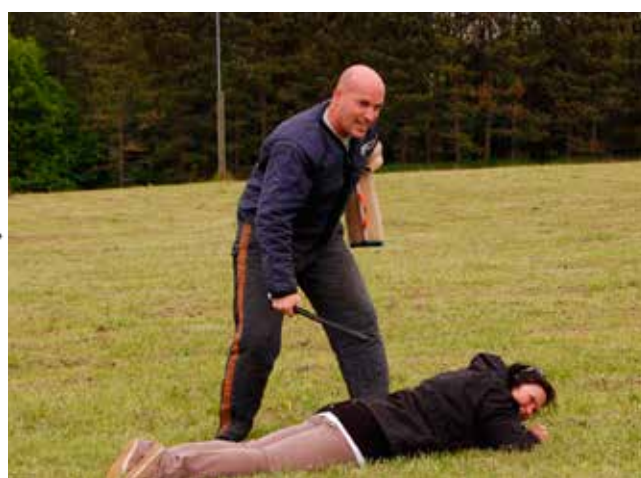
...og samtidig få stokkeslag - til hvilket formål?