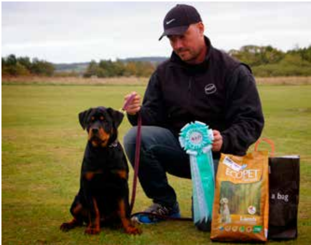
Fairmoors Cafú til sin første udstilling i Skive Rottweilerklub 05.10.13. SL 2 i Babyhanner. Tak til Skive Rottweilerklub for en dejlig dag, man kunne ikke mærke, I kun har eksisteret i få uger. Foto og tekst: Helle Andersen