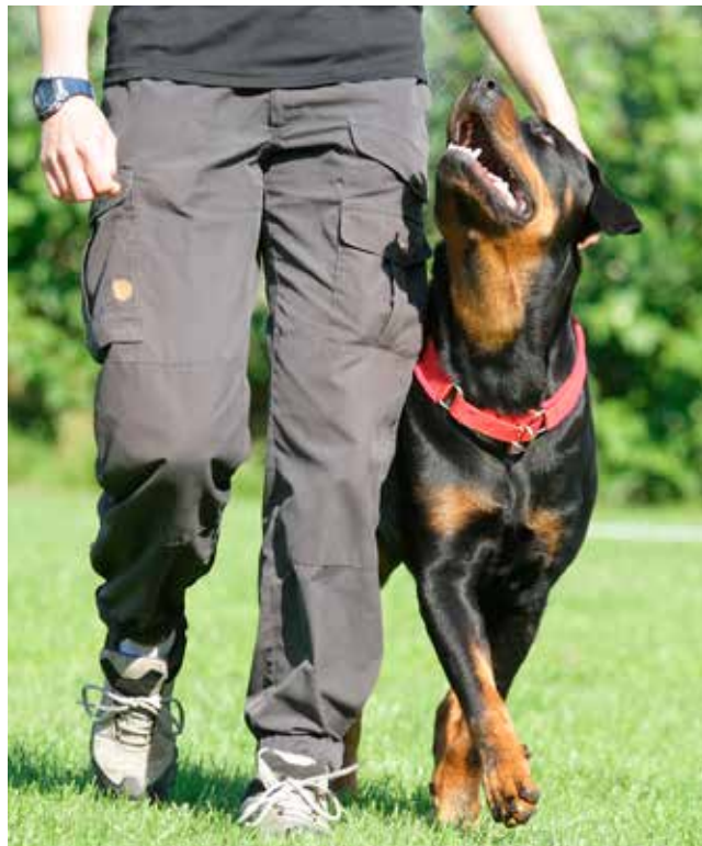
Første Rottweiler med den flotte titel.