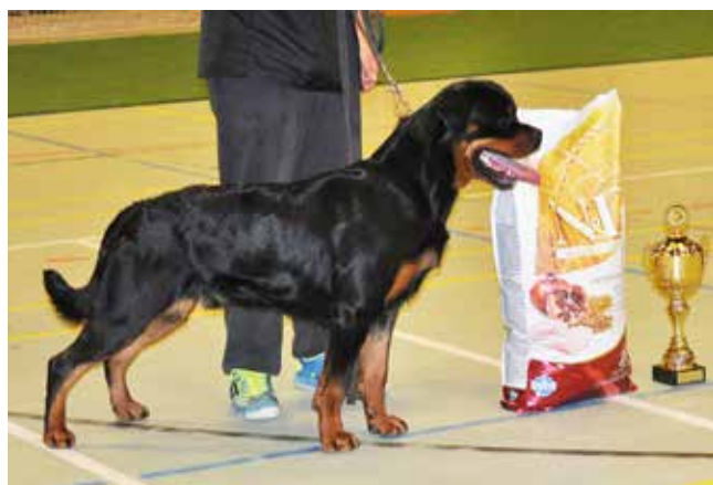
Arzadon Quito RKD Jule Junior vinder.