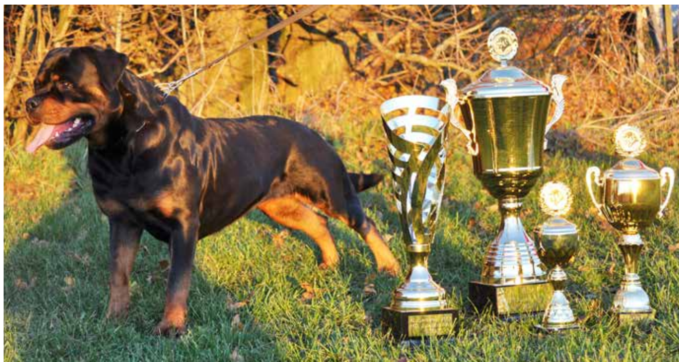
Heitah's Yuma BIM Klubvinder 2013.