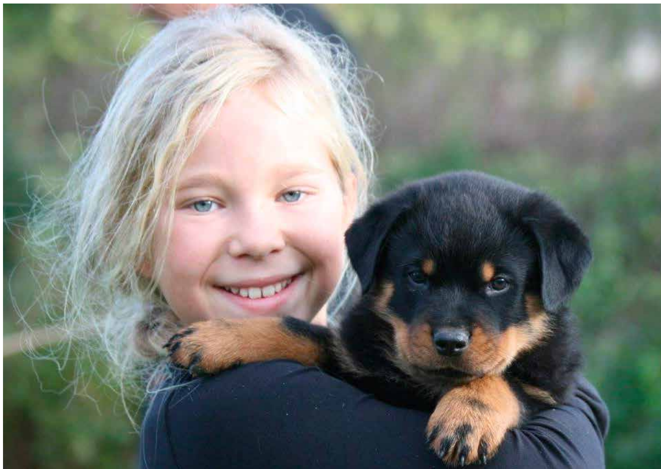
Vælg den rigtige hund, før du avler.