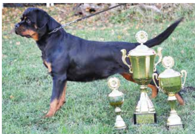
Heitah's Cora Crush RKD Julejunior vinder.