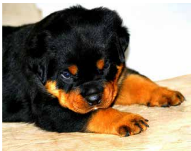
Hvis jeg nu ser sådan ud længe nok...?