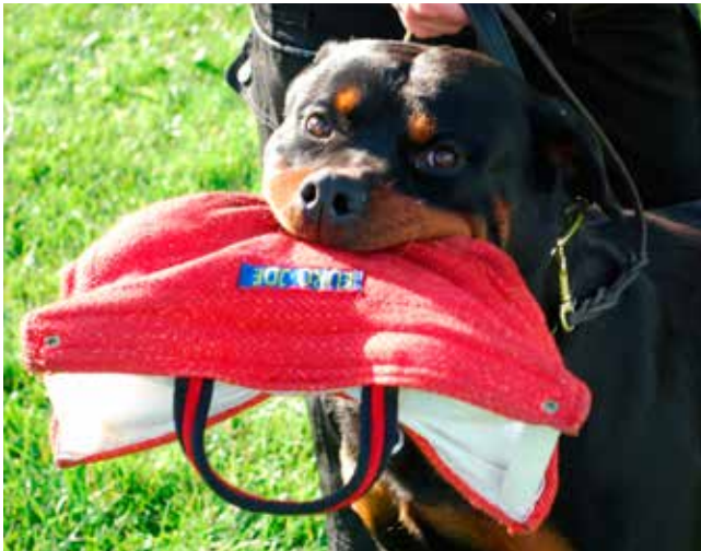
Træning med VM holdet.