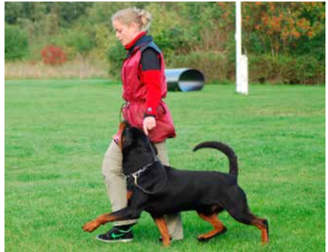
Træning med VM holdet.