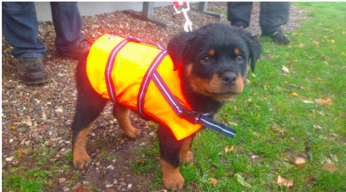
Det kan være koldt at vente, hvis man bliver gennemblødt.

”Kredsene informerer” på side 31-32 - find din egen kreds heriblandt.