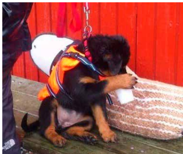
En hurtig kop kaffe, imens man venter.