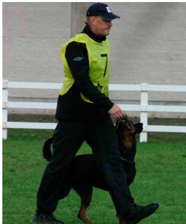
Lydigheden i top.