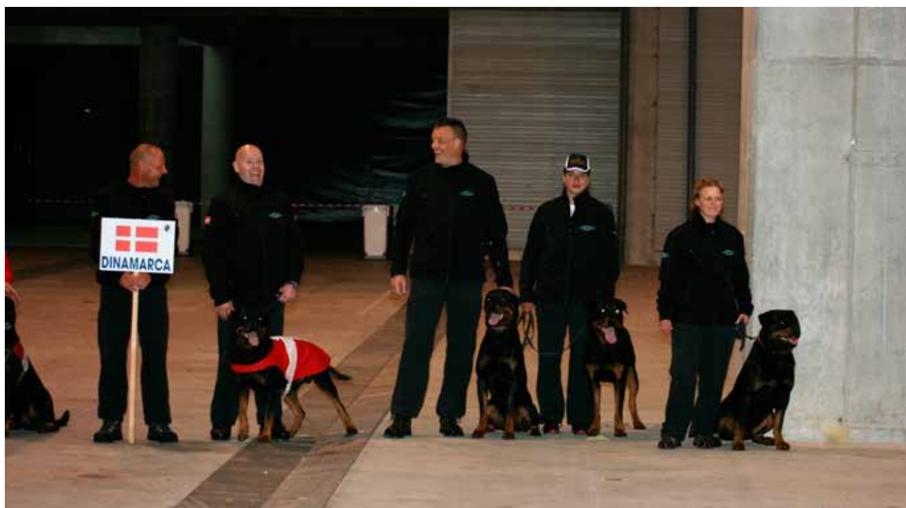
Holdet ved indmarch - læg mærke til den gode stemning. Det danske hold blev nr. 3 i holdkonkurrencen.