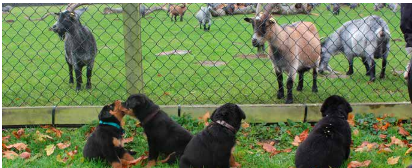
De fire drenge Dancer, Dezmo, Dexter og Diesel kigger meget interesseret på de sjove geder, men kigger mon egentlig mest?