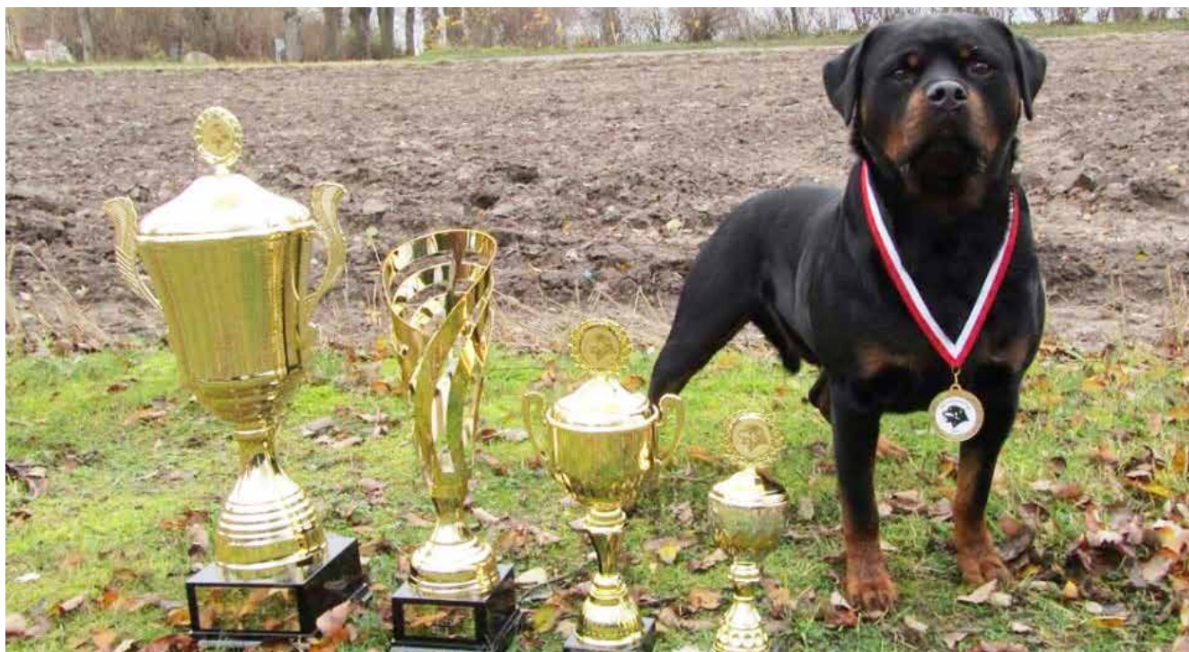
Von Hause Nomis Icon BIR.