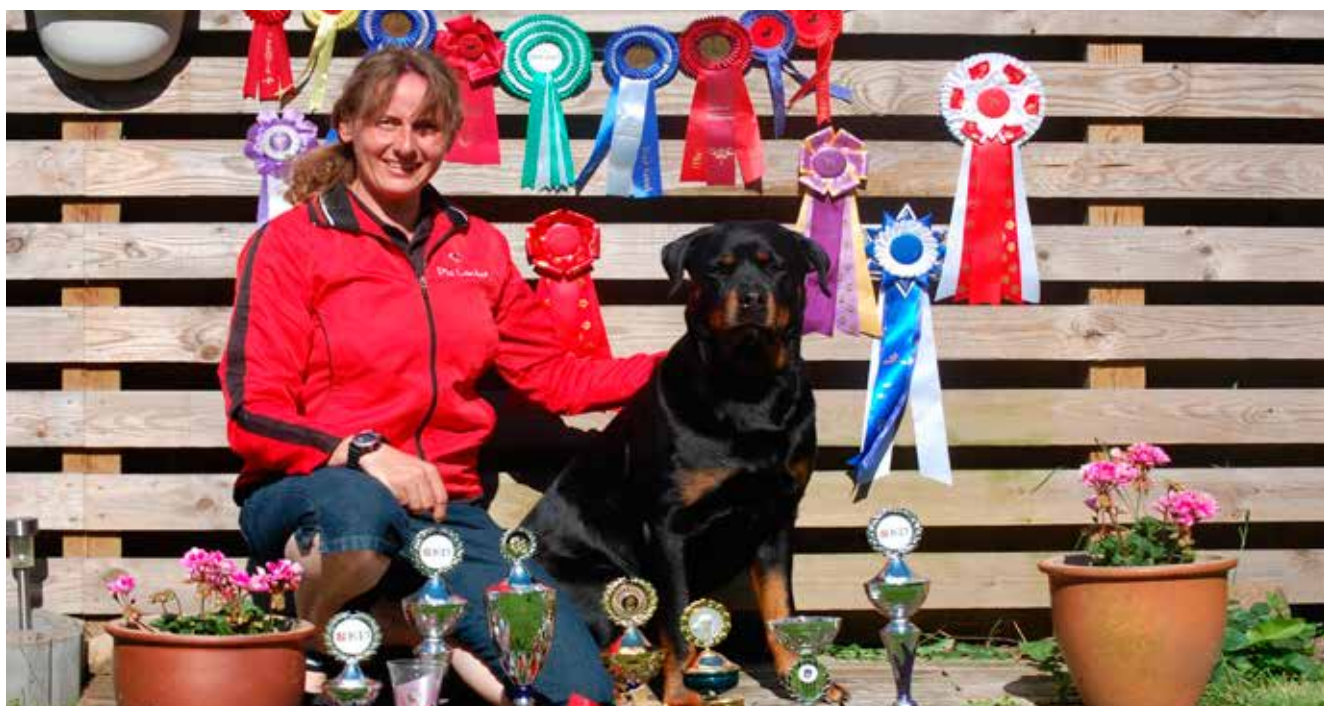
FP. BpB. BpAB. IPO V IPO 1. LP1. LP2. LP3. DKLPH. RBM. RØM. DKRLCH.