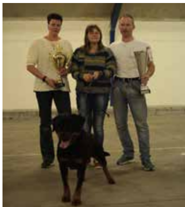
Heitah's Cora crush BOS KLBV14