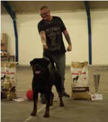
Vom hause wenorra Basuka2 KLBV14