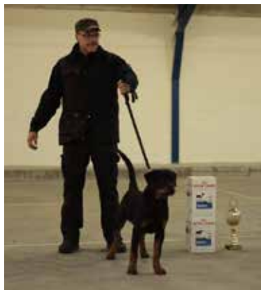
Arn - Best Baby

Billeder fra Juleudstillingen.