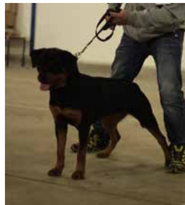
Heitah's Gwen - Junior winner female