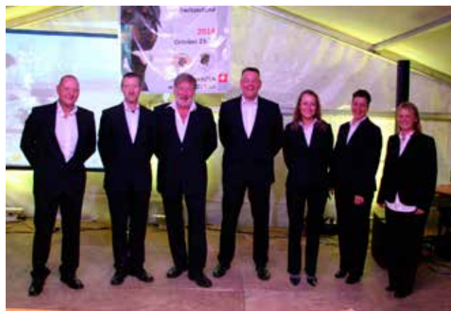
Alle deltagere parate til gallamiddag.