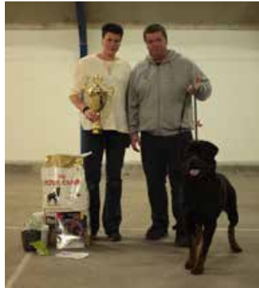
Von barnewitz Enkas BOB