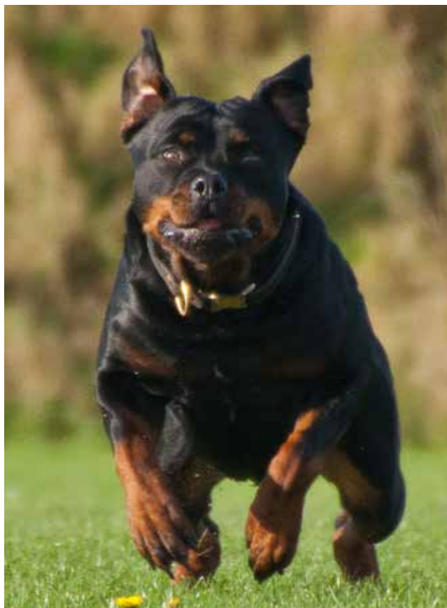
ABC Royal's Fillucca.