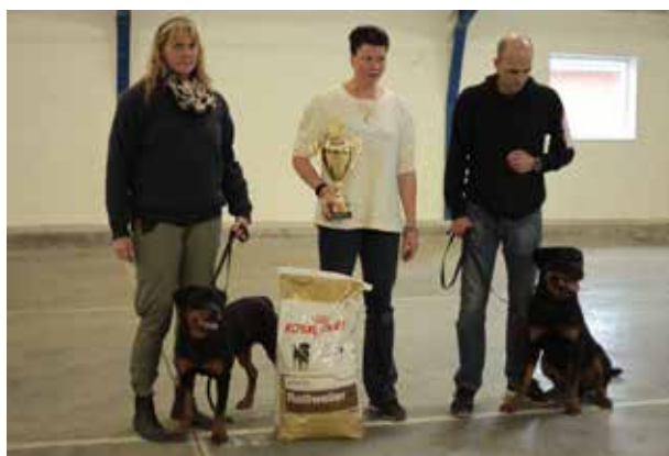
Shamigo's Gaia - best Puppy & Opperby's Diesel