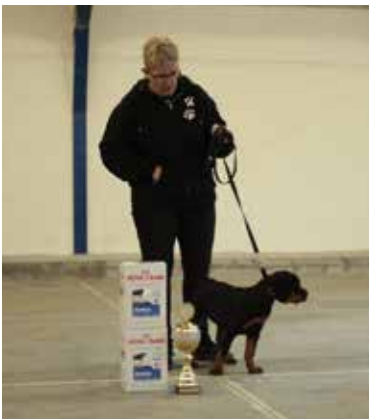
Vom hause nomis Pasja