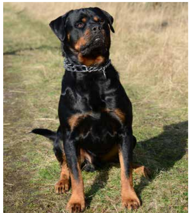
Linda Vejlings "Gentleman": Nord Sea Side Iglo von Bizz